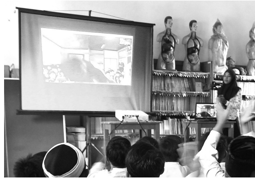
(写真1 画面越しに挨拶をする参加者)

多くは、相手のいる場所まで直接行くことが様々な理由から難しい状況にある。そこで、インターネット等を活用し、対面の状況を用意する。