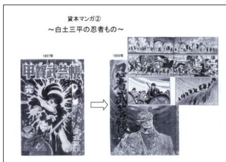
パワーポイント資料 ①

またパワーポイントの導入により、OHP スライドとは比較にならないほど詳細で、分かりやすい資料の作成が容易になった。反面、ともすると情報量が多くなりすぎる傾向がある。学生が時間内に消化可能な量を超えてしまわないよう、適切かつ最小限に絞ることを心がけている。論理的なポイントは板書するほうがメリハリ上もスピード的にもいいように感じるので、パワーポイントは基本的にビジュアル専用としてきた（歌詞を見ながら歌を聞く場合は文字だけだが）。