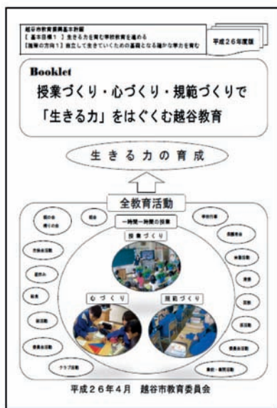
図11 授業づくり、心づくり、規範づくりで「生きる力」を育む越谷教育

ブックレットの中には、前述の教師と児童の自己評価表や3つの重点活動についても掲載し、教師がいつでも自分の授業を振り返ることができるよう工夫している。