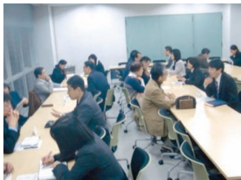
図10 文教大学とのプロジェクト会議

果を研究授業や研究紀要として市内各学校へ広め市内教師の指導力の向上させることで児童生徒の学力向上を図っている。特に本市の課題である算数・数学会、理科部会では、前述の市独自で実施している学力調査の検証問題作成にも携わっている。さらに、これらの部会では、文教大学と教師等の研修に関する協定を結び、「教育研究員ジョイント事業」として文教大学の各教科・領域等担当の教授、准教授を部会の活動に招聘し指導・助言をいただいている。