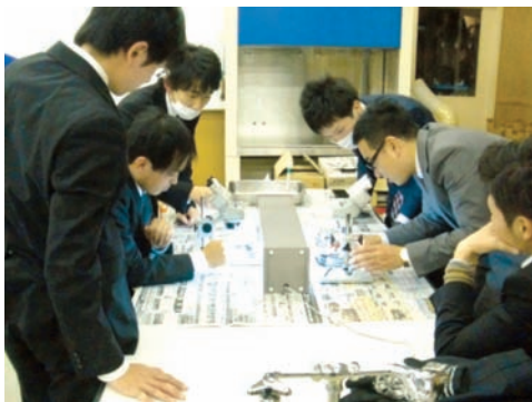
図8 理科実験・実技自主セミナー

1つめは、小学校教師対象の理科実験自主セミナーの開催である。小学校の教師からは「理科の実験準備が大変」「教科書と同じような結果にならない」など実験を伴う授業に自信の無い声が多々聞かれていた。そこで、2012年から、年5、6回放課後に本市の科学技術体験センターや児童館を利用し希望者を対象に実験の実技研修を行っている。参加者は毎回10～30人程度で、事前に不安