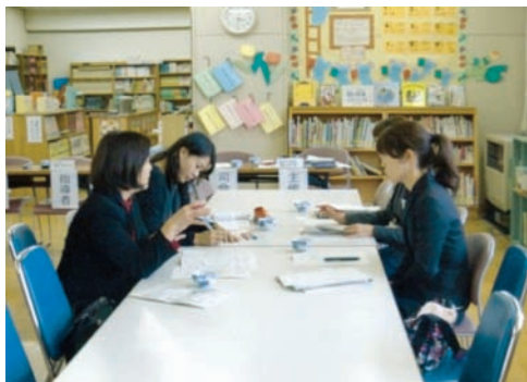
図9 指導法改善 家庭科部会

本市では、各教科・領域における指導法改善部会を設け、小学校教諭及び中学校教諭3～4名を選出し研究を行っている。各部会では、先進的な取組を行っている学校の視察、各種学力調査の結果の分析やそれらを解決するための指導法を研究し、各研究部員の実践報告や活発な意見交換がなされ、研究部員の指導力を向上させている。また、その実践結