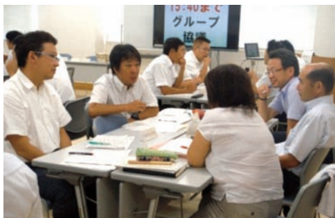
図6 教育課程・学力向上研修会

成果の上がっている学校では、日課のなかに短時間の学習を設定したり、全校で共通理解を図り家庭学習に取り組んだり、定期的な学力テストを行ったりしている。また、日々の授業においても教師の講義的な授業から、児童生徒が自力で、あるいは仲間と学び合い問題を解決する問題解決的な授業を行ったり、児童生徒があとで学習の流れがわかるようなノート作りの指導など知識・技能を活用する場面を意図的に設定したりしている。これら成果の上がった取組は、市内の小・中学校に広まるよう、自校の課題解決プランを持ち寄った教務主任・学力向上担当対象の研修会を実施し情報交換やプランの検討を行っている。