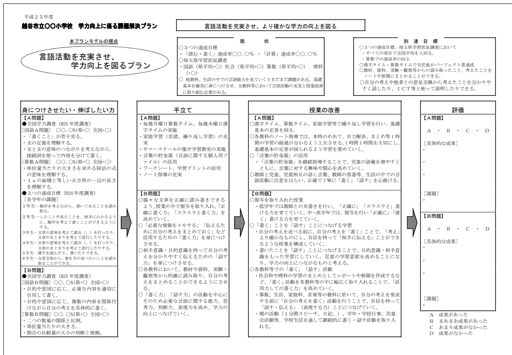
図5 学校課題解決プランの例

学校課題解決プランは、埼玉県教育委員会作成の「学校課題解決プランモデル集」を参考に越谷市独自の学校課題解決プランのひな形を作成し各学校に配布している。プランは①全体計画、②年間計画、③教科等改善プランの3部で構成されている。①全体計画では、PDCAサイクルを生かして、P：課題解決プランの作成、D：実践、C検証、A：課題解決プランの改善、の4段階のサイクルで検証するよう設定している。