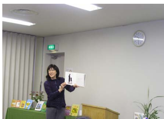
「読み聞かせの実践」