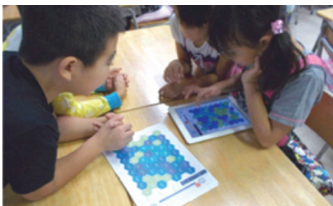
図4 児童がアプリ『たし算パズル』で活動する様子

第2学年では、アプリ『たし算パズル』(Digital Gene)を使用し、学習動機として「充実志向」を持って活動に取り組むように「課題解決型」の学習内容を設定した。算数科の授業で、計算をしやすくする工夫をする単元において、数を計算しやすいように分解するという概念を持たせる学習を行う。『たし算パズル』を1人1問ずつ解いていき、多数の小さな数を足して特定の数字を作る。特定の数字へと足していく過程で、先に10のまとまりを作る計算等といった、暗算でより早く簡単に計算の仕方を獲得していく。学習内容としては高度なものであり、計算が得意な児童でも楽しく計算の工夫の仕方を学べるようにアプリを使用して楽しく学習活動に取り組む(図4)。