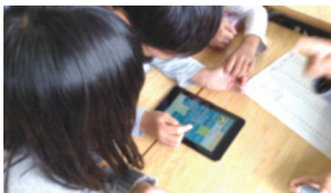
図3 児童がアプリ『しりとりタッチ』で活動する様子

第1学年では、アプリ『しりとりタッチ』(transcosmos.inc)を使用し、学習動機として「報酬志向」を持って活動に取り組むように「課題解決型」の学習内容を設定した。国語科の授業で、ひらがなで表記された意味のある語句に親しむ学習を行う。『しりとりタッチ』を1人1ステージずつ行い、制限時間内により多くのステージをクリアした班に表彰状を与えることを導入で伝える。児童はその表彰状を手に入れるために意欲的に学習活動に取り組む(図3)。