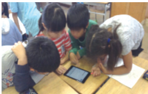
図5 児童がアプリ『ピノバ2年算数』で活動する様子