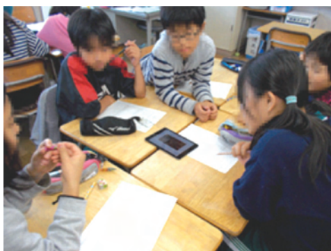
図8 児童が電子書籍教材を見ながら話し合いをする様子

第6学年では、『iBooks』を使用し、学習動機として「実用志向」を持って活動に取り組むように「課題解決型」の学習内容を設定した。道徳の授業で、同年に発生したSNSに関するトラブルを踏まえた情報モラル学習を行い、今後同様なトラブルを起こさないための学習を行う。『iBooks』に文部科学省がYoutubeで配信している映像の1つである、小学校高学年向けの情報モラル教材を使用し、自作の電子書籍教材を作成した。各班ごとに題材であるSNSトラブル事例の発生原因・解決方法・実生活への活用を話し合い、発表する学習活動に取り組む(図8)。