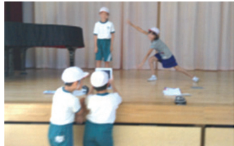
図7 児童がカメラアプリでムービーを撮影する様子

(apple. inc)で撮影して、撮影したムービーを『iMovie』で編集し、作品を完成させる。完成した作品に様々な切り替え効果や文章、音楽を取り入れて、創意工夫を凝らしたものを制作する学習活動に取り組む(図7)。