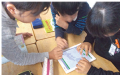
図6 児童がアプリ『日本パズル』で活動する様子

第4学年では、アプリ『日本パズル』(Digital Gene)を使用し、学習動機として「訓練志向」を持って活動に取り組むように「課題解決型」の学習内容を設定した。社会科の授業で、夏休みの宿題であった日本の県名を覚えてくる勉強の復習として、そして県名だけではなくその県形や位置をさらに学ぶために学習を行う。制限時間を設定し、『日本パズル』を1人1回ずる解いていく。互いにヒントを出し合ったり、日本地図を参考にしながら解き、回を重ねる毎に解くスピードは上がっていき、日本の都道府県に関する知識をより深めながら学習活動に取り組む(図6)。