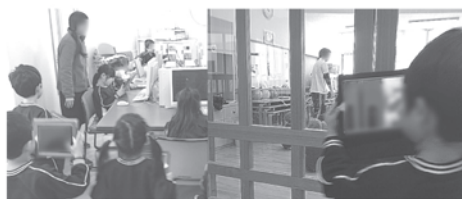
図4 「大好きなところ」活動の様子

上記のように、小学校「生活科」と保育領域「環境」の連携を視点に、ICTを活用した活動を整理することができた。次頁にその他の実践を整理し、一覧にしたものを表3として示す。