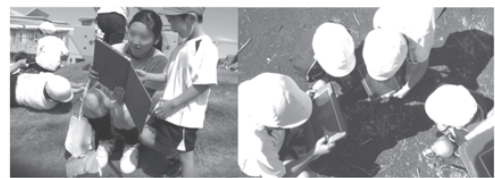
図2 「昆虫採集の記録」活動の様子

(7) 動物を飼ったり植物を育てたりして、それらの育つ場所、変化や成長の様子に関心をもち、また、それらは生命をもっていることや成長していることに気付き、生き物への親しみをもち、大切にすることができるようにする。