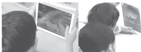
図3 「お正月遊び」活動の様子

(5) 身近な自然を観察したり、季節や地域の行事に関わる活動を行ったりなどして、四季の変化や季節によって生活の様子が変わることに関心し、自分たちの生活を工夫したり楽しくしたりできるようにする。