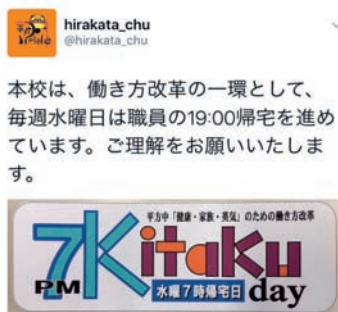
図 16 水曜7時帰宅日周知のツイッター投

プロ教員としてのリアルな日常観察に加え、客観的な自己申告のデジタルデータの両面から子供を見つけることは、意義あることと考え、この「コンケア」を1学年全員(111名)にモニタリングすることにした。同時に、教職員の勤務時間管理、メンタルヘルス把握にも活用できると教職員(28名)でも活用することにした。6月中旬から開始し、1学期終了時まで実施した結果、生徒、教職員のデータ