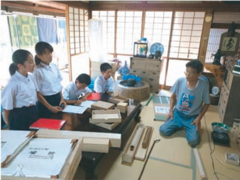
図7 地域の良さ PR のミッションに地域の人が生徒たちの学習会に参加