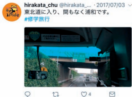
図 12 修学旅行の帰路。バスの中から現在位置を発信するツイッター画面

まず、教師である。教師はICTを授業や校務に使う教材、便利ツールとだけ考える時代ではない。学校ホームページをはじめ学校からの情報発信もICTを活用している。これからは家庭・地域、そして社会に開かれた学校をマネジメントする時代である。その視点からもICTは効果的なツールとなる。本校では、学校ホームページの他に公式ツイッターを活用し、生徒たちの活動や学校の様子を即時配信している。部活動の大会結果などタイムリーな情報や安全・防災面など緊急連絡の拡散にも活用でき有効である。そこで、研修の実施、校内利用規程などで共有し合い、多くの教師が発信できるようにしている。学校行事時などには大変有効で、7月に実施した3年生修学旅行でも教師が京都・奈良の各所から生徒の様子を発信したり、帰りのバスがどこまで来ているリアルタイムな情報を提供したりと、保護者と地域にも歓迎され、多くの閲覧者がいる。ホームページ、ツイッター、メール配信と教師も発信、更新ができることで、自分たちも学校の情報発信や開かれた学校づくりに役立っているという有用感や存在感を得られる効果にもつながる。その際、生徒の個人情報をはじめ、各種権利の扱い、ネット上のルール・マナーや注意事項についての各研修や見守り、見届けも随時必要で、こうし