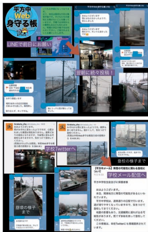
図 14 Web 身守る帳活用の流れ

可能な方々を募り、グループを作成。台風、大雨、降雪などの予報が出たときは、前日などに校長が投稿をお願いする。協力者は、夜半や朝方に変化や異常があった場合に写真付きでコメント投稿をする。位置情報も追記できるため学校はそれを随時確認し、適切な判断材料とすることができる。協力者も出勤や朝の家事の合間に簡単に投稿できるとともに、自分の投稿が学校への貢献となるとあって、意欲的・積極的に朝は5時頃から投稿が続く。これも生徒同様自己肯定感、自尊感情、そして使命感や成就感が大きなモチベーションとなるようだ。