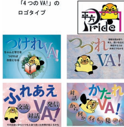
図11 学校教育目標を示すロゴタイプと学校キャラクターの「マナビバー」の組合せ、「4つのVA!」のロゴタイプ

にこうした言葉が飛び交い、自分たちが取り組んでいることへの特別感、連帯感が高まっている。これらの感覚は、モチベーションの高揚となり、結果的に「チーム学校」の意識化につながるのである。