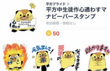
図 13 生徒会主導全校で作成したLINEスタンプ。LINE上で販売している。

昨年7月に生徒会本部役員が全校集会で呼びかけ、スタンプに添える言葉を集めた。「ありがとう」「ごめんね」という定番から「プライドを持とう」や勉強中、消灯するのでLINEはできないを意味する「今日はここまで」「天才になってきます」「進化中」など