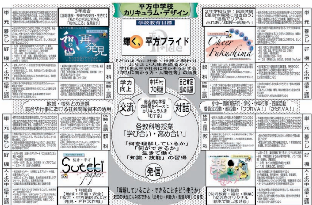
図2 平方中学校カリキュラム・デザイン

元文部科学省視学官、現國學院大学教授である田村学(2017)は、各校のカリキュラムがどのような教育目標を受けているのかを考え、「主体的・対話的で深い学び」につなげるためには、カリキュラムをいかにデザインしていくかが問われているという。そして、教科横断的な視点、組織的配列、PDCAサイクルの確立、人的・物的、地域等の外部の各資源