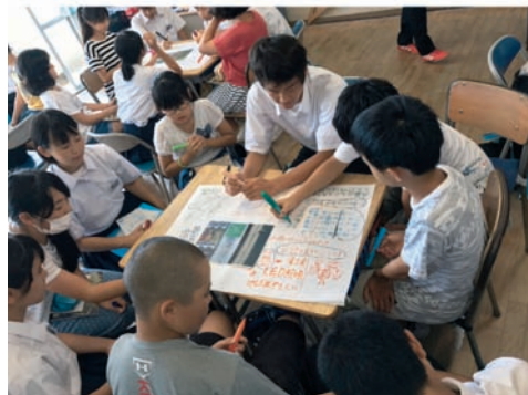
図10 修学旅行の成果を小学生と共有する 3年生：「かたれVA!」実践

が、3年生にとっては自分たちの学びの成果を他者に語ることで、より学びを深め、再構