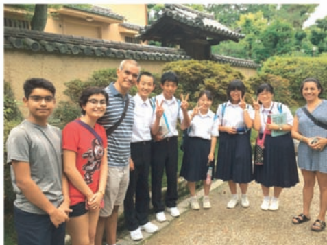
図9 京都で外国人家族にインタビューする 3年生たち

つの小学校へ分かれて訪問し、旅行中に発見した事や取材した「和のこころ」を6年生に披露する機会も設定した。各班で撮ってきた自分たちがこれぞ「和のこころ」だと思った写真を提示し、小学生に説明しながら互いに話し合った。