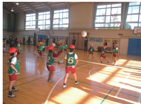
図2 集団達成型学習のチームプレルの様子

ての項目において高い数値を示しており、特に「主体的な学び」の視点としての「意欲・関心」では第1時から2.76と高く、さらに授業が進むにつれて値は上がる。その背景を分析すると手立てとしてのドリルゲームでパス・キャッチ・アタックを繰り返し練習したことが技能の定着につながり、さらにドリルゲームのチームプレル（集団達成型学習）での授業ごとの計測による記録の更新が「できた」という達成感をもたらし、他のチームの伸びをも称賛できる肯定的な人間関係が形成されたと考えられる（図2，図3参照。なお，チームプレルの第5時についての回数は，単元後半のため，ネットを挟んで行うやり方に変化したため，ネットに当たって減少したり，目標物ができて回数が増加したりしたと考えられる）。