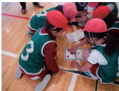
図4 作戦会議の様子

他者と協働しながら運動に取り組ませるためには、教師の丁寧な児童への関わりと、学び合いを促す積極的な声かけが大切である。