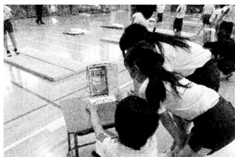
図6 演技後の自己の画像を確認