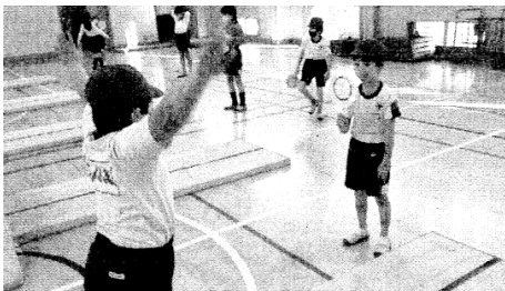
図5 「ジャッジうちわ」を使用した例