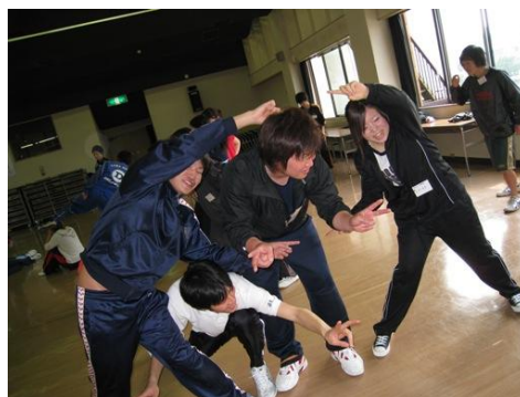
特別研修のひとこま

より、学校はどんなところなのか、児童や教員の素顔はどんななのかがよく見えてくる。いわば教育実習を1年生からやっているともいえるが、派遣学生に及ぼす効果は教育実習以上のものがあると感じている。