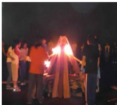
夏合宿のキャンプファイヤー

夏は、富士山麓に出かけ不登校児童・生徒をマンツーマンでサポートし、寝食を共にし、そして富士登山に挑戦する。励ましあいながらそして時に叱咤しながら自然の厳しさと美しさを共に感じ、偉大な富士を克服した力を我がものとする。体力の限界の中で本気を出し、その強さを自信として明日からの自分を変える原動力につなげる合宿である。夏合宿は、偉大な自然を相手として人としての懐の深さを培う合宿とも言えよう。